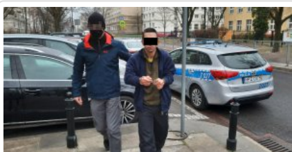
Mężczyzna podejrzan o kradzieże rowerów