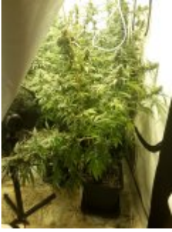
Plantacja konopi indyjskiej