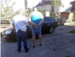
Mężczyzna podejrzany o przestępstwa narkotykowe