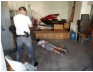
Mężczyzna podejrzany o przestępstwa narkotykowe