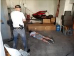
Mężczyzna podejrzany o przestępstwa narkotykowe