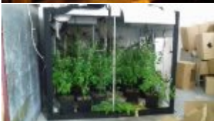
Plantacja konopi indyjskiej