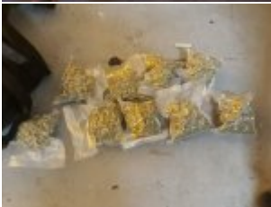
Zabezpieczone przez policjantów narkotyki