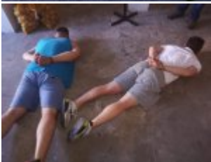
Mężczyźni podejrzani o przestępstwa narkotykowe