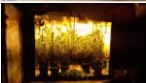
Plantacja konopi indyjskiej