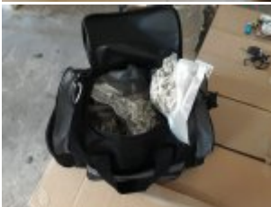
Zabezpieczone przez policjantów narkotyki