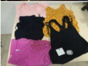
Odzyskana przez policjantów odzież