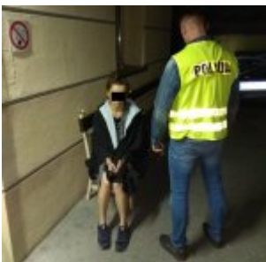
Kobieta podejrzana o kradzież