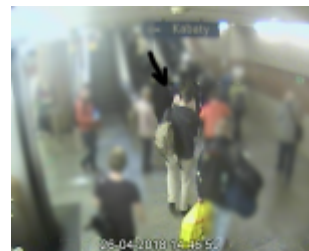
Mężczyzna podejrzewany o uszkodzenie ciała