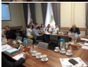
Rozmawialiśmy o bezpieczeństwie z pracownikami Mazowieckiego Kuratorium Oświaty