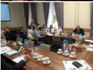
Rozmawialiśmy o bezpieczeństwie z pracownikami Mazowieckiego Kuratorium Oświaty