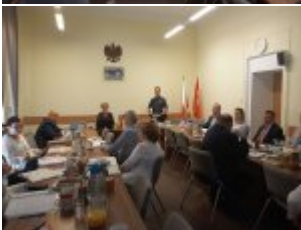
Rozmawialiśmy o bezpieczeństwie z pracownikami Mazowieckiego Kuratorium Oświaty