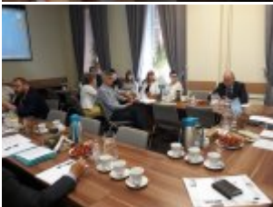
Rozmawialiśmy o bezpieczeństwie z pracownikami Mazowieckiego Kuratorium Oświaty