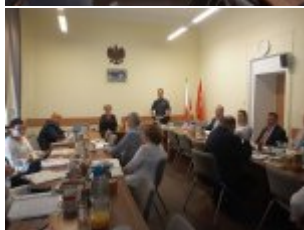
Rozmawialiśmy o bezpieczeństwie z pracownikami Mazowieckiego Kuratorium Oświaty