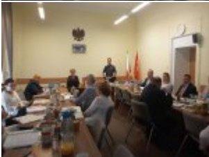
Rozmawialiśmy o bezpieczeństwie z pracownikami Mazowieckiego Kuratorium Oświaty