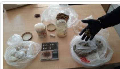
Zabezpieczone przez policjantów narkotyki i waga elektroniczna